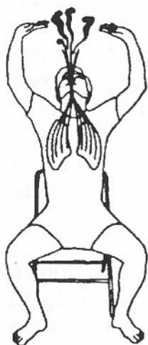
1. Lunge: Ssss