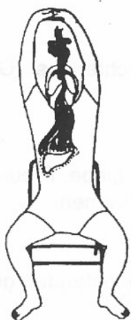
3. Leber: Sch (runde Lippen)