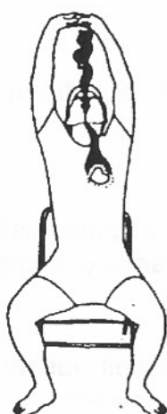
4. Herz: Hao (Ha)