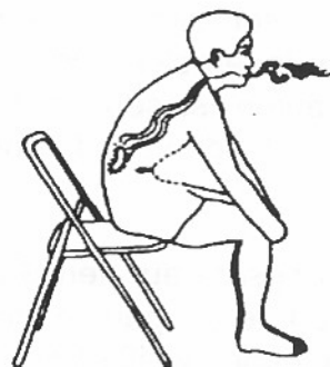
2. Nieren: «Kerze ausblasen»